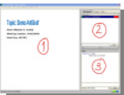
Pantalla que se visualiza en una Reunión

Si es una reunión pública, no tiene más que pulsar sobre TODAY'S MEETING y luego sobre el indicador de dicha reunión. Si es privada y le han comunicado la contraseña, deberá escribirla.