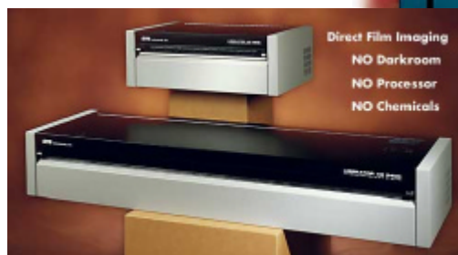
Liberator (de 18 a 54 pulgadas de ancho)