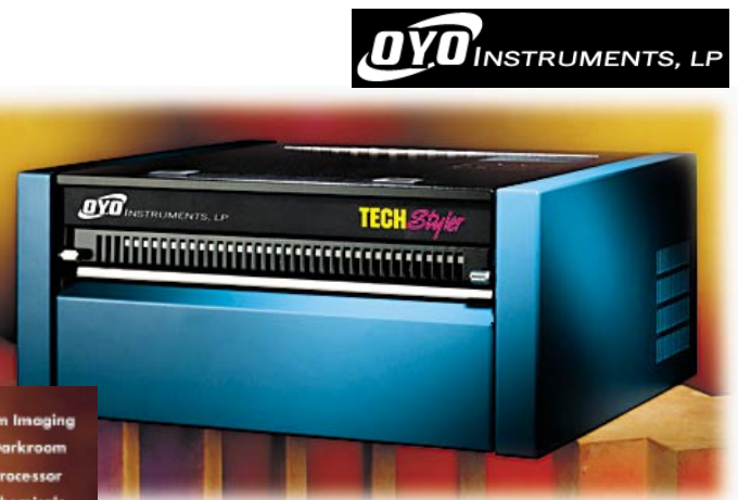
TechStyler (de 14 pulgadas de ancho)