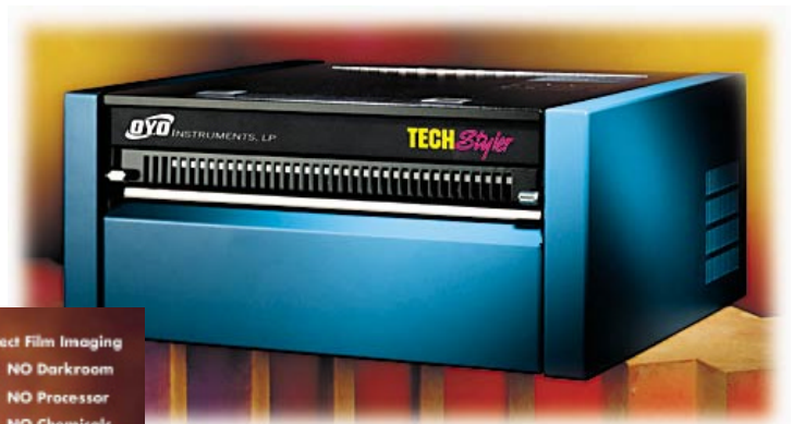
TechStyler (de 14 pulgadas de ancho)