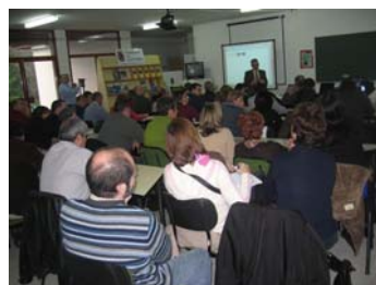
Gran atención de los directores de los Centros de Primaria durante la demostración de la Pizarra InterWrite