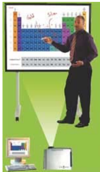
Pizarra Interactiva InterWrite SchoolBoard

El ordenador tiene acceso inalámbrico a Internet, lo que le permite conectarse desde cualquier lugar del centro.